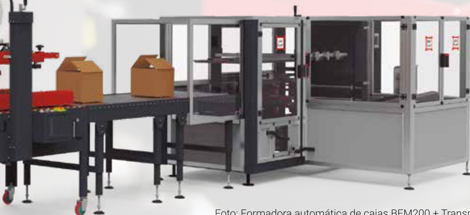
Foto: Formadora automática de cajas BEM200 + Transportadores de rodillos para cajas + Cerradora semiautomática P15 + Transportador extensible de roldanas

Photo: Automatic Case Former BEM200 + Rollers conveyors for boxes + Semiautomatic Case Sealer P15 + Extendable wheels conveyor