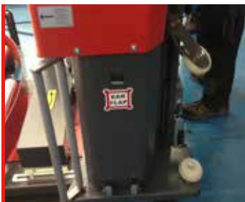
Prestirotor motorizado 300%