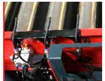
Sopladores de cola inicial