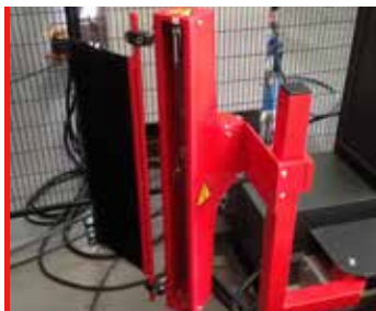
Brazo corte de film