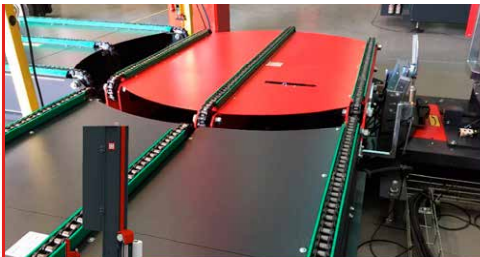
TRM500 con transportador de 3 cadenas